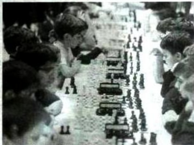
Las partidas exigían momentos de gran concentración.