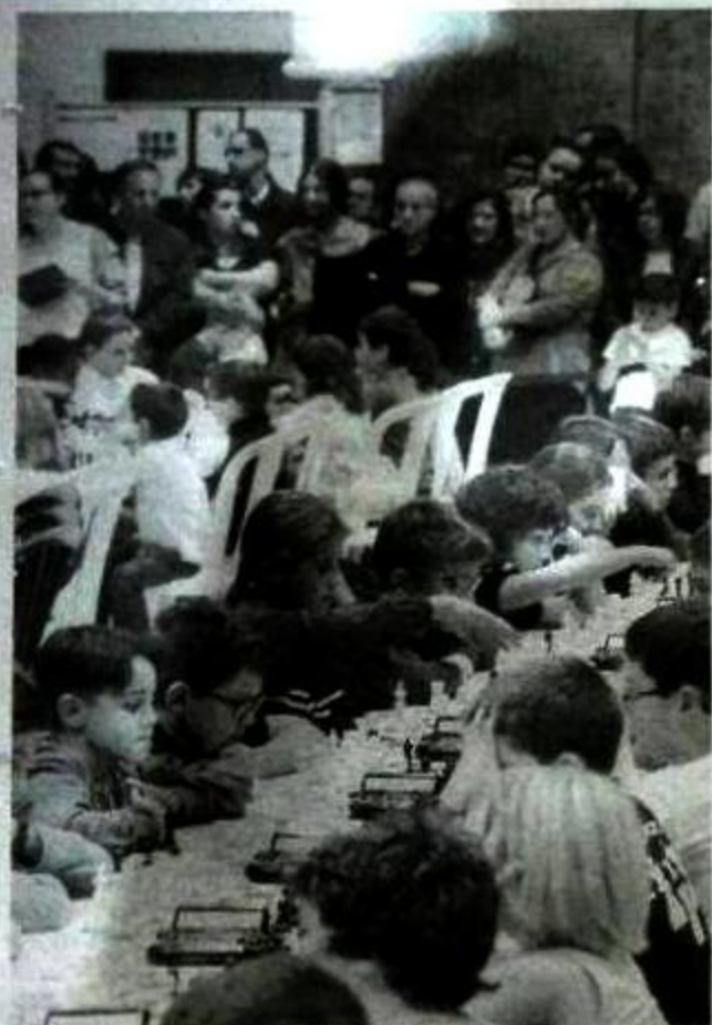
El público no perdía detalle de lo que ocurría en las mesas.