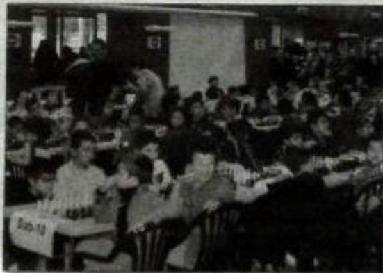
O futuro do xadrez ourensá está asegurado, aquí os xadrecistas da categoría Sub-10.