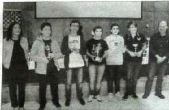
Os cinco primeiros clasificados de cada categoría recibiron un agasallo.