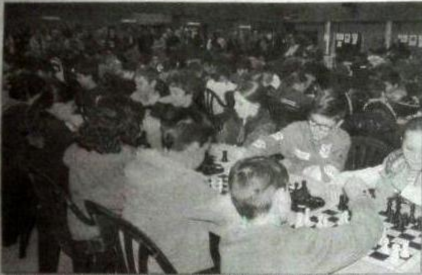
Alta Ourense se achegaron clubs de toda Galicia, norte de Portugal e Castela e León.