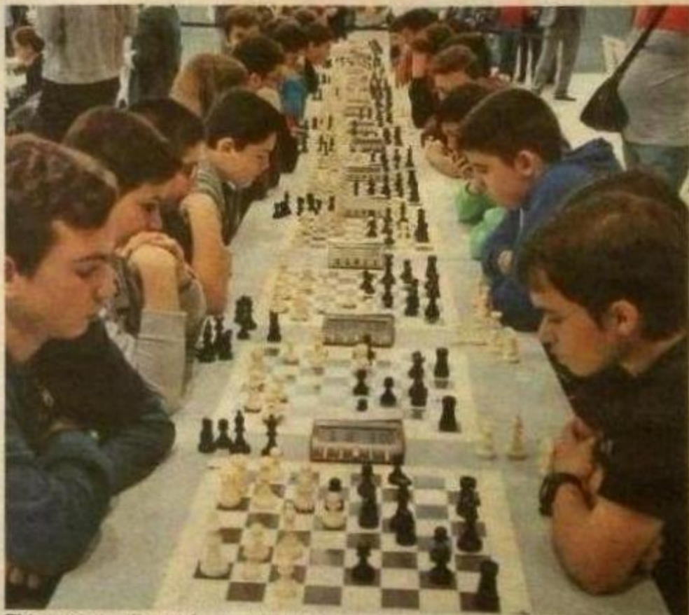
El torneo se disputó con el sistema suízo.