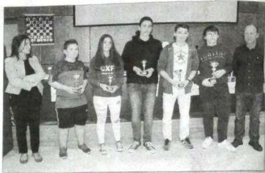
Na foto os cinco primeiros clasificados na categoría Sub-18.