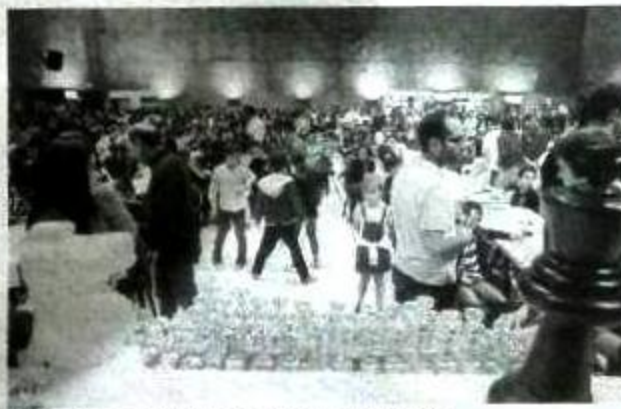
Los trofeos esperaban por los mejores clasificados.