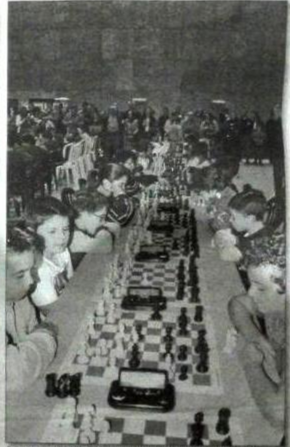
A novena edición do Festival Internacional de Xadrez xuntou a máis de 300 xogadores.